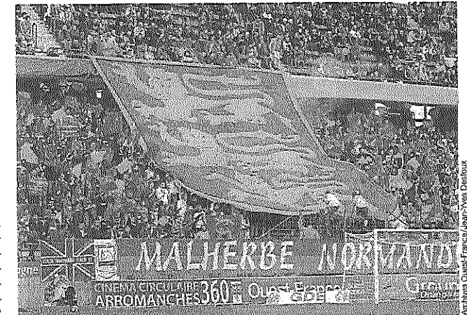
La campagne d'abonnement pour la saison 2011-2012 débute le jeudi 23 juin pour les anciens abonnés, le 30 juin pour les nouveaux abonnés.

Le calendrier de la saison 2011-2012 sera connu vendredi. Campagne d'abonnement dès le 23 juin.