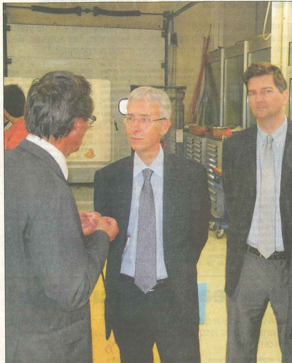
Le préfet Didier Lallement (deuxième à gauche) lors de sa visite d'un atelier au CFAI du Calvados et de la Manche, hier à Caen.